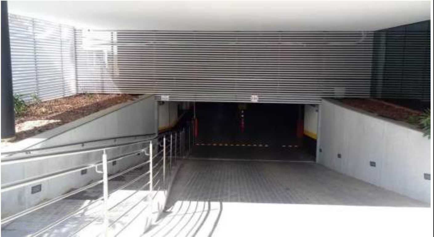
Gradis e portões