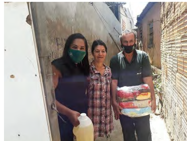
Servidora da Defensoria Pública em Conselheiro Lafaiete faz entrega de doação no mês de agosto/2020.