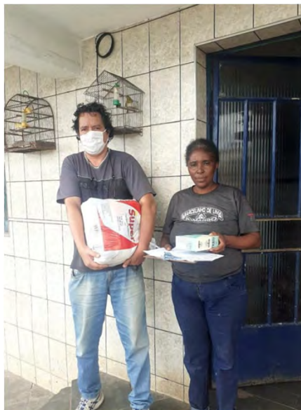
Outro registro de entrega de doações, realizada no dia 25/11/2020.