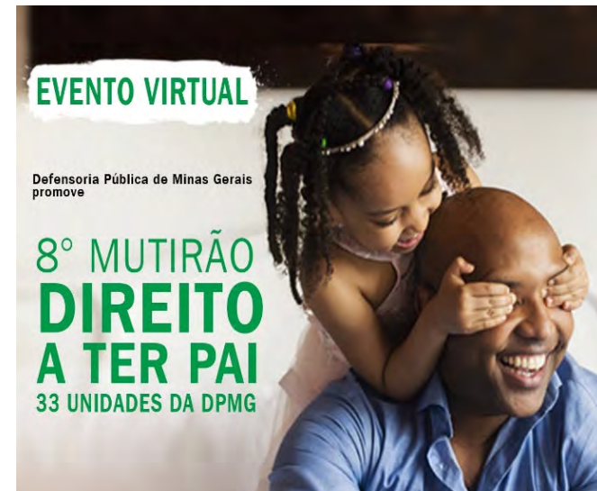
Cartaz de divulgação do Mutirão Direito a Ter Pai

Tem como objetivo ainda, garantir à criança, ao adolescente e ao adulto o direito a ter o nome do pai em seu registro de nascimento por meio de ações efetivas voltadas a esse fim, promovendo, não só o reconhecimento da paternidade, mas a conscientização quanto a importância da aproximação entre pais e filhos, possibilitando ainda a reconstrução de vínculos afetivos, que são de extrema importância a formação do ser humano.