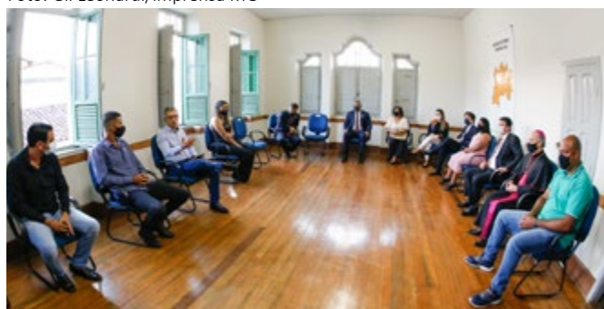
Encontro com representantes de atingidos pelo desastre de Mariana