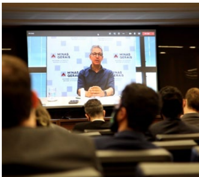
Governador Romeu Zema: “resultados com trabalho conjunto”

Em seu pronunciamento no Curso de Formação, o governador destacou que a Defensoria Pública “tem sido grande parceira do Governo”, e que o contato regular e próximo com o defensor-geral e a chefe de Gabinete, Raquel Gomes de Sousa da Costa Dias, tem possibilitado a solução ágil e conjunta dos desafios que se apresentam.