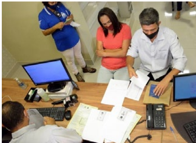
Casal entrega os documentos para a habilitação para o casamento no Cartório de Registro Civil do 4º Subdistrito de Belo Horizonte