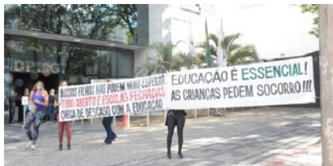
Pais de alunos cobraram soluções na porta da Defensoria Pública