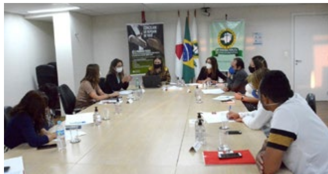
A reunião aconteceu na Sede I da DPMG, em Belo Horizonte