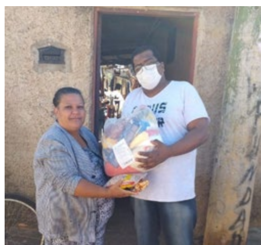
Registro de uma das entregas feitas às famílias

A Defensoria Pública fez a entrega das doações às famílias semanalmente, na medida em que foram arrecadadas. Para receber as doações, as famílias em situação de vulnerabilidade da comarca fizeram o cadastra-