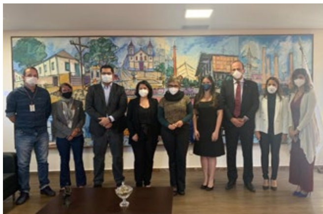
Representantes do Executivo municipal, das secretarias de Educação e Saúde e da procuradoria-geral do município também participaram do debate.

Na reunião foi anunciado que as aulas presenciais da educação infantil, em Contagem, serão retomadas no início de agosto, de forma híbrida, gradual e facultativa às famílias. A prefeita Marília Campos apontou as tratativas em andamento para o retorno das aulas presenciais. Foi apresentado ainda um planejamento para que até meados de julho sejam definidos o projeto pedagógico para o ensino híbrido e o calendário de volta às aulas.