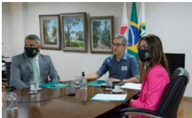
Governador preside a reunião do Comitê Covid-19 do Gabinete da Defensoria-Geral