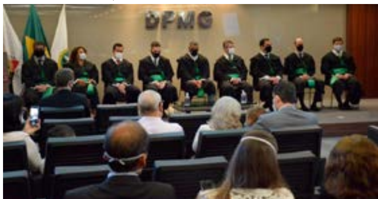
Conselheiros e defensor público-geral de Minas Gerais, Gério Patrocínio Soares, durante cerimônia de posse no auditório na sede da DPMG