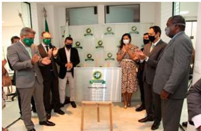
Descerramento da placa de identificação da Unidade