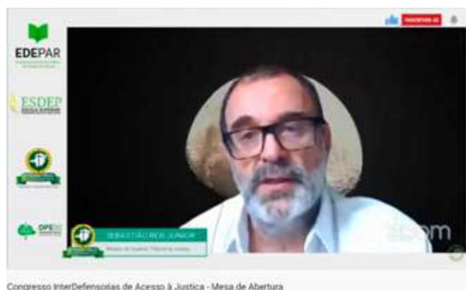
Congresso InterDefensorias de Acesso à Justiça - Mesa de Abertura

Palestra magna – Com o tema “Interdefensorias e o acesso à Justiça”, o ministro do Superior Tribunal de Justiça (STJ) Sebastião Reis Júnior abriu as palestras do encontro. O ministro revelou estar “impressionado com a qualidade técnica e disposição das defensoras e defensores públicos de todo o país em defender aqueles que se encontram em situação menos privilegiada”.