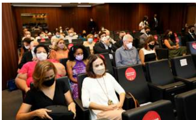
Mesmo com restrição de número, devido à Covid-19, familiares dos novos defensores puderam prestigiar a cerimônia presencialmente