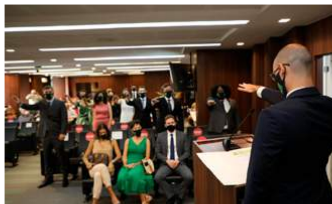
Novas defensoras e novos defensores públicos de Minas Gerais prestam o compromisso