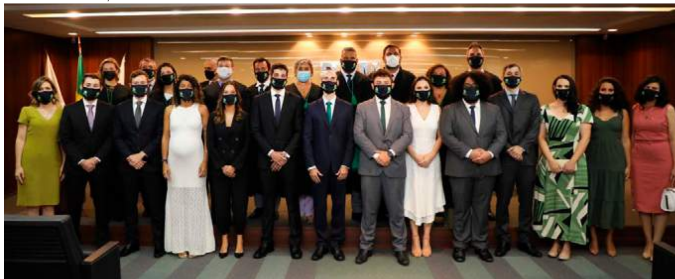
Empossadas, empossados, membras e membros do Conselho Superior da Defensoria de Minas, e o presidente da Associação de Classe