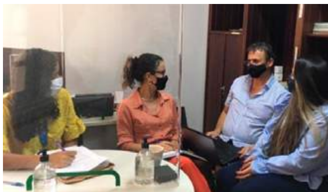
Defensora pública, professor, aluna da UFU e estagiária da Defensoria Pública durante reunião realizada em 8 de abril para análise prévia dos dados coletados até o momento

A iniciativa pretende traçar o perfil demográfico das mães e pais que são réus nos processos de destituição do poder familiar que tramitam na comarca. O projeto tam-