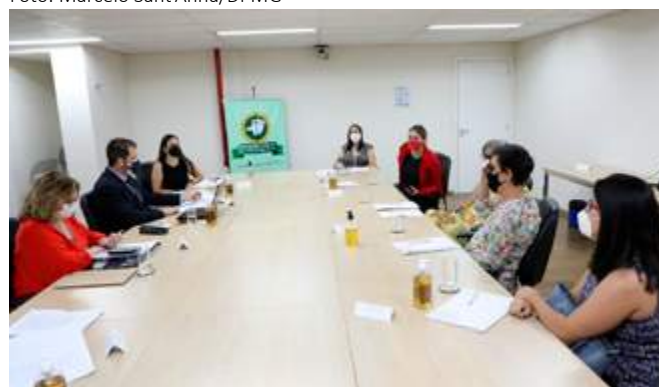
Encontro aconteceu na sede da Defensoria de Minas, em BH