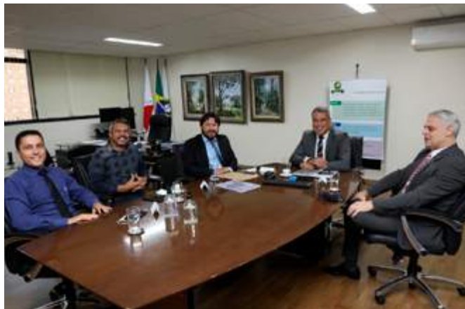
DPG e defensor público-auxiliar recebem representantes do Município de Timóteo