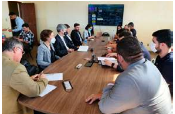
Representantes das instituições participam de reunião com vereadores e membros da prefeitura