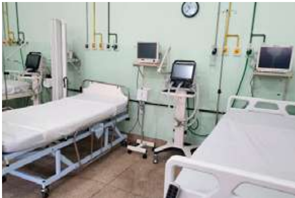
Sala de Urgência na UPA Valdemar de Barros recebeu novos equipamentos