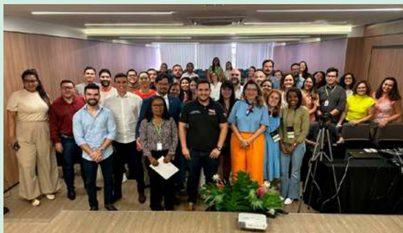
Congresso compartilhou práticas e cases de sucesso de diversos órgãos do Sistema de Justiça

Entre os dias 08 e 10 de novembro, ocorreu a XVII edição do Congresso Brasileiro dos Assessores de Comunicação do Sistema de Justiça