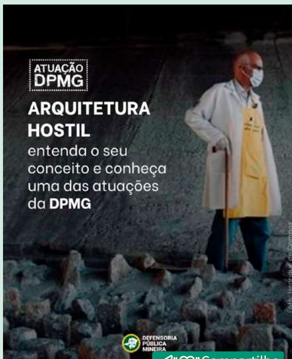
Lei em vigor desde 2022 proíbe a chamada "arquitetura hostil", que utiliza estruturas, equipamentos e materiais com a intenção de afastar pessoas, incluindo aquelas em situação de rua, jovens e idosos, de praças, viadutos, calçadas e jardins.